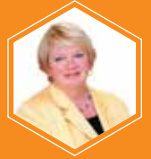
كاثرين بيندون مدير أول برنامج رواد تكاتف

تتولّى البروفيسورة كاثرين بيندون إدارة برنامج «تكاتف» للطلبة العُمانيين، بعد أن كانت مستشارة لرئيس جامعة البحرين، والمدير المؤسس لكلية البحرين للمعلمين، والرئيس المؤسس للجامعة الملكية للبنات. وقد عملت كاثرين مسبقاً في كندا متولّية مناصب متعدّدة عليا في خمس محافظات كان آخرها رئيسة جامعة كلية أوكنجن.